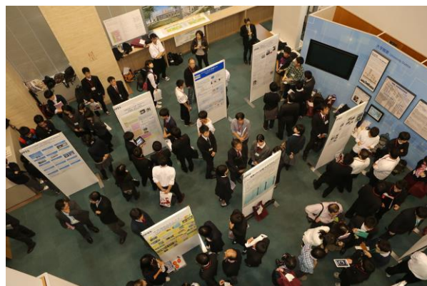
昨年(2015年)のポスター発表会場の様子